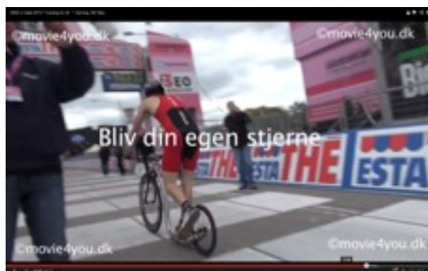
Nogle af deltagerne ved GIRO d'Italia starten 2012 i Herning