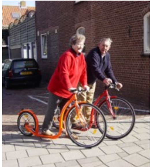
Et pensionistpar på motionstur