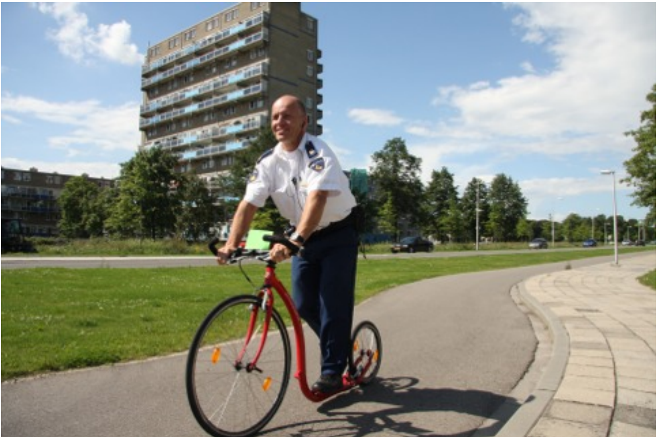
Politiet lånte sportsløbehjul af arrangørerne under VM 2008 i den hollandske by Kampen