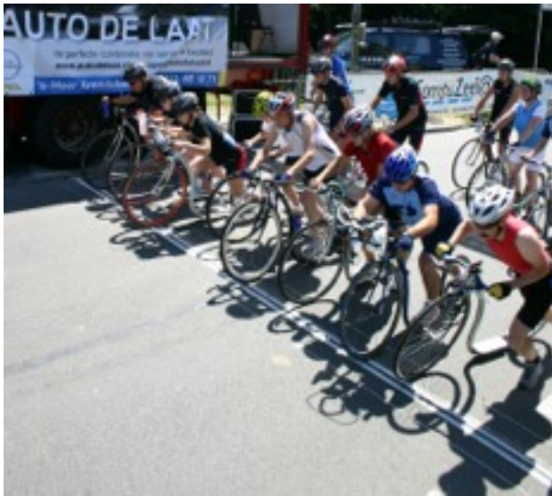
Startfeltet ved en EuroCup Holland 2012